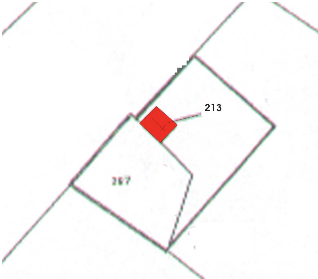
Stralcio di mappa catastale